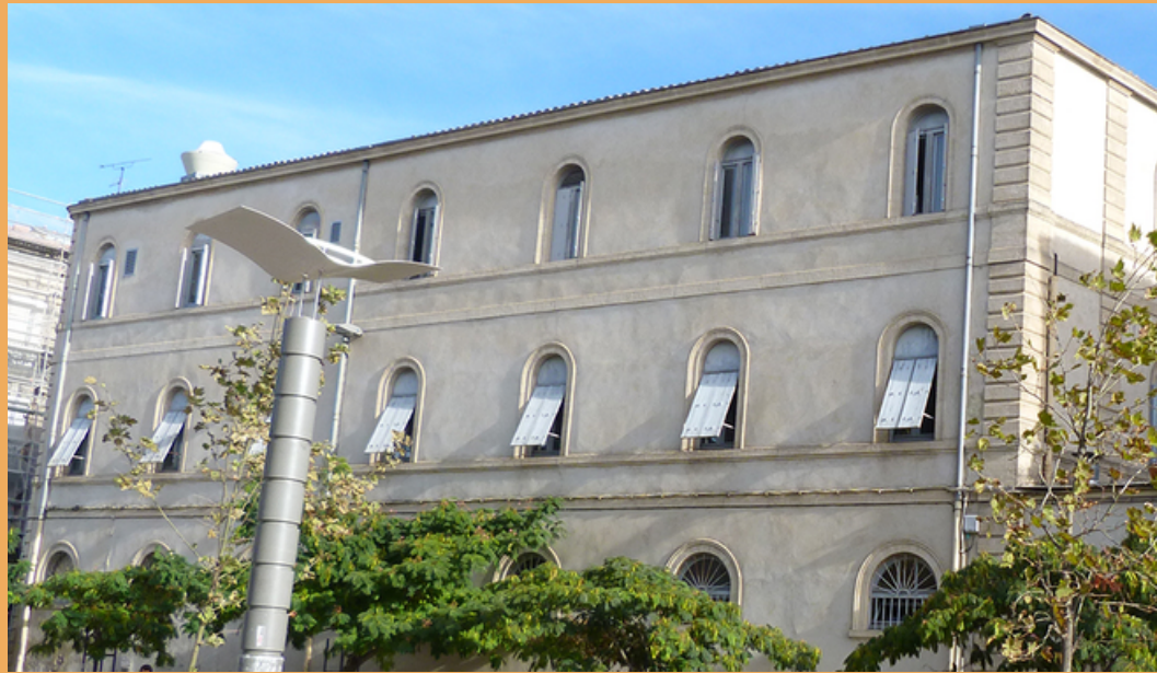
Lycée Notre Dame de la Merci (Privé)