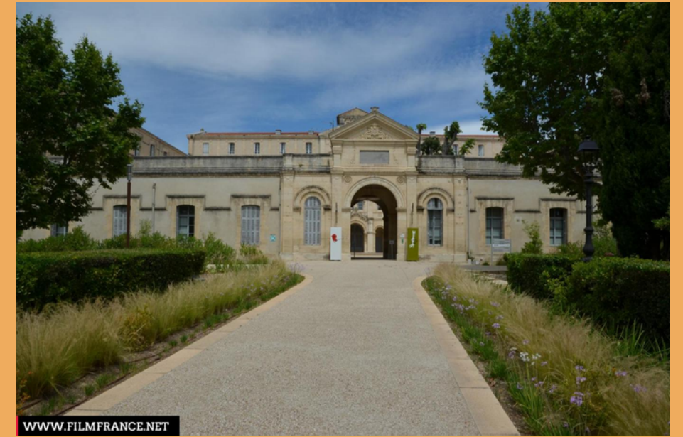
Lycée Françoise Combes (Lycée d'excellence)