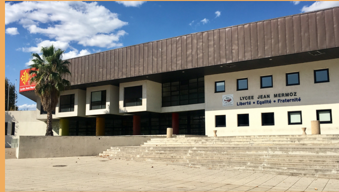
Lycée Jean Mermoz (Public)